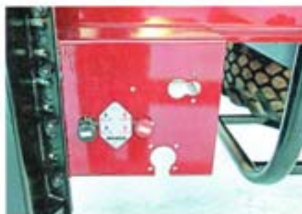
Пульт пневмоуправления стояночной тормозной системой

к внутренней части емкости, что необходимо, например, для проведения профилактических, ремонтных работ, обслуживания и чистки. Для того чтобы обеспечить герметичность стыка, инженеры спроектировали надежные уплотнения, которые изготовлены из особого вида полимера, прекрасно работающего в широком диапазоне тем-