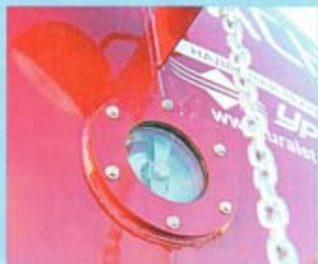
Механический указатель уровня заполнения емкости