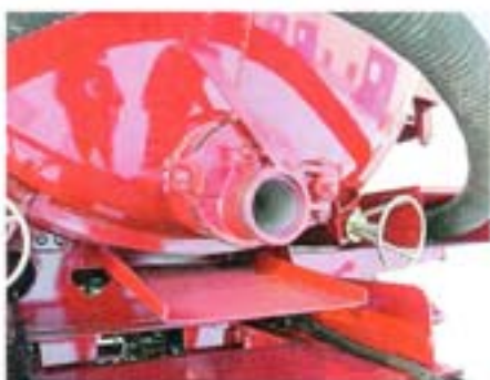
Смонтированный заборный/сливной узел емкости имеет высокий ресурс

местности, ящик ЗИП или даже дополнительный топливный бак. Перевозчик может сам выбрать нужный вариант. Корзина изготовлена из гнутого стального профиля, обладает хорошей прочностью, крепится к раме болтами. При необходимости конструкция может быть оперативно демонтирована.