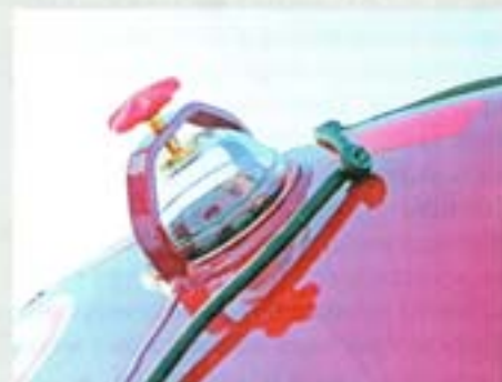
Специальный смотровой люк облегчает контроль за содержимым цистерны