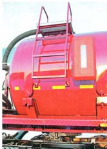
Цистерна оснащается лестницей для подъема на площадку обслуживания