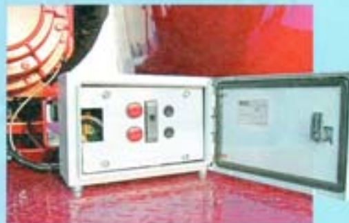
Блок контроля за операцией заполнения емкости и управлением дополнительным освещением рабочей зоны

пригодность. Так, заварить трещину в корпусе могут на любой СТО, поскольку для выполнения данной операции требуется обычное сварочное оборудование. Для расширения спектра выполняемых вакуумной цистерной задач предусмотрено нанесение на ее внутреннюю поверхность специальных защитных покрытий, которые предохранят металл от коррозии и разрушения под действием агрессивной среды. Среди вариантов исполнения есть и версия из нержавеющей стали. Изготовленная из нее цистерна способна решать более широкий спектр задач, но и стоит она не в пример дороже выполненной из низколегированной стали 09Г2С. В списке вариаций значится и модель с термоизолированным корпусом. В качестве материала для термоизоляции завод