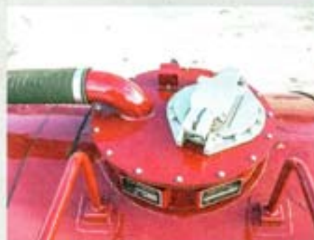
Дополнительный люк для верхнего налива в цистерну