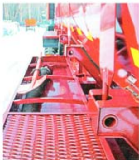
Пенал для укладки напорного рукава расположен вдоль цистерны

качеством модели Juror PNR 122 является взрывобезопасное исполнение. Это существенно расширяет сферу применения вакуумной машины.