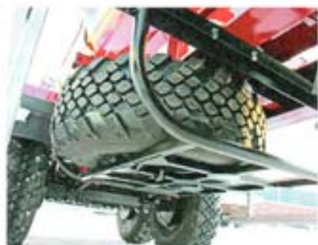
Подрамная корзина для крепления запасного колеса и прочего оборудования

Цистерна укладывается на раму, имеющую ряд конструктивных особенностей. Неразрезная конструкция изготовлена из мощных швеллеров двутаврового профиля. Ложементы, на которые укладывается цистерна, сварены в раму, а крепление емкости выполнено стяжными лентами-хомутами. При таком техническом решении обеспечивается некоторая подвижность цистерны, что снижает воздействующие на нее внешние нагрузки. Чтобы исключить протирание металла в местах контакта цистерны с ложементами, в наиболее нагруженных местах наварены так называемые бронелисты. Также стоит обратить внимание на такую интересную разработку завода, как большой площади подрамная корзина. В нее могут быть уложены запасные колеса, что очень важно при выполнении перевозок по пересеченной