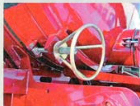
Вентиль запирающий открывающегося днища цистерны