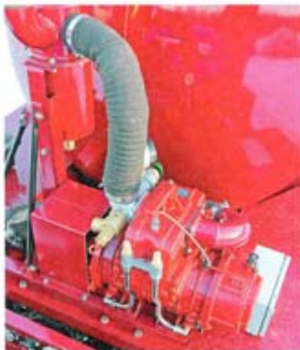
Насос Jurgor PNR 122 шиберный, с воздушным охлаждением, итальянского производства

С точки зрения эксплуатации внимания заслуживает вариант цистерны с открывающимся дном. Такое техническое решение позволяет получить свободный доступ