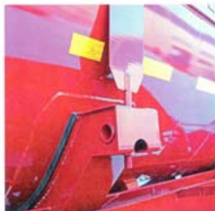
Крепление емкости в ложементах рамы при помощи стяжных лент

ператур и стойко переносящего воздействие агрессивных сред. Это очень важно, так как вакуумные прицепы часто используются нефтедобывающими компаниями в холодных регионах России для сбора пролитых нефтепродуктов. Также большое внимание конструкторы уделили и замковым механизмам с петлями, которые обеспечивают точное позиционирование и прилегание крышки к емкости. Примечательно, что всю фурнитуру предприятие производит самостоятельно. Привод замковых механизмов – механический. Такой практически не требует обслуживания, ну разве что смазки винта, и со-