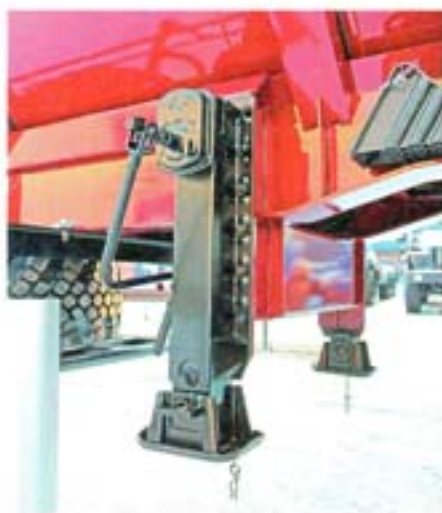
Опорные устройства от ведущих производителей данного типа оборудования